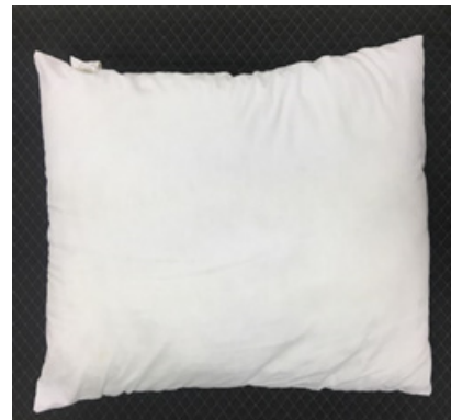
Fig. 2. General pillow.

자 4) 상지 감각 및 운동 기능에 신경학적 증상이 있는 자 5) 외부 충격에 의한 상해 등이 있는 자는 연구 대상자에서 제외하였다[14]. 모든 대상자는 연구의 목적 및 측정 방법에 대해 설명을 듣고 동의서에 서명하였으며, 건양대학교 기관생명윤리위원회의 승인(KYU 2021-06-007-001)을 받아 진행하였다.