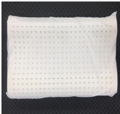
Fig. 1. Functional latex pillow.